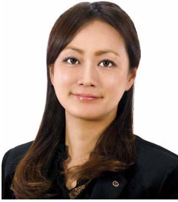
大分商工会議所青年部 平成28年度 第35代会長